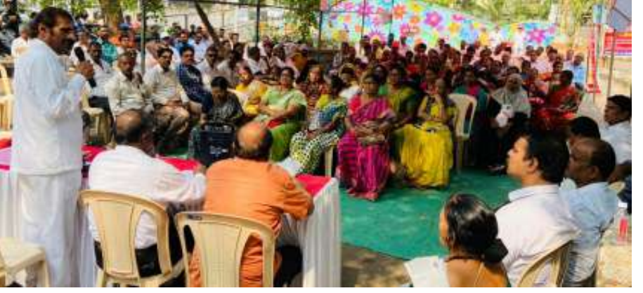
वतीने सिडको कार्यालयावर निदर्शने करण्यात आली होती. यावेळी

सरकारने काढलेल्या सिडको प्रकल्पग्रस्त घरांना नियमित करण्याच्या अध्यादेशात बदल करून प्रकल्पग्रस्तांची घरे(बांधकामे) त्यांच्या नावे कायमस्वरूपी करण्यात यावीत. या दोन प्रमुख मागण्यांसह नैना प्रकल्प रद्द करण्याच्या मागणीसाठी शुक्रवारी उरण येथील सिडको बाधित जमिन व घरे बचाव कृती समितीच्या